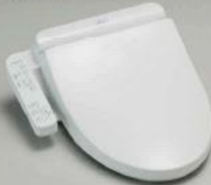
標準カラーカラー