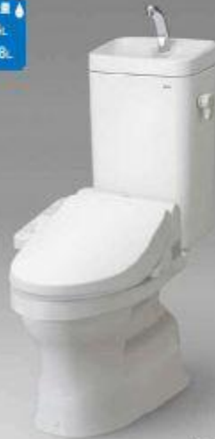
標準カラーカラー