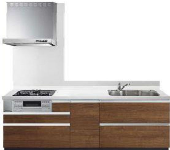
※1扉裏のHは、イメージ写真です。 ※2扉裏のHは、HSPです。

無垢のない表面でフタラク 収納も取り出し。 使いやすさを優先した オールスライド収納タイプ。