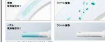
※TOTOは抗菌剤の使用を推奨していません