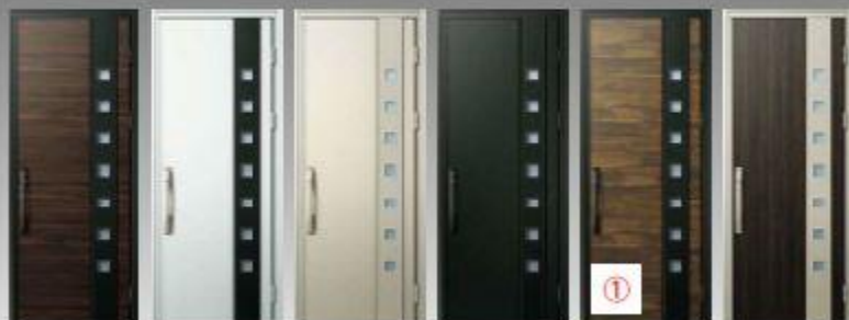
ボニーアカンパ(4F) 6,8R / 3,4 / 0,8 ビュアシルバー(41) 9,38 / 8,0 / 0,1 プラチナステン(42) 3,0Y / 6,7 / 0,6 コームブラック(43) 9,3P / 3,2 / 0,3 スキークロココ(44) 6,9YR / 3,7 / 1,2 黒鉄(45) 9,8R / 3,1 / 0,4