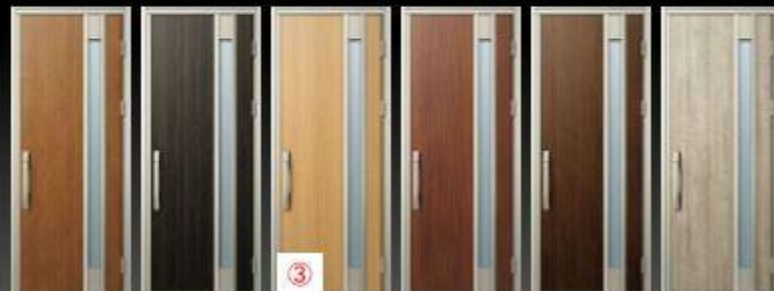
キャサリンオーク(46) 7,5YR / 4,3 / 0,2 黒鉄(45) 9,8R / 3,1 / 0,4 ハニーオーク(47) 8,2YR / 5,9 / 0,2 ダークシナモールナイト(48) 1,1YR / 3,6 / 2,4 シヨウウエールナイト(49) 3,0YR / 3,3 / 1,1 コナラウッド(40) 6,9YR / 6,1 / 0,8