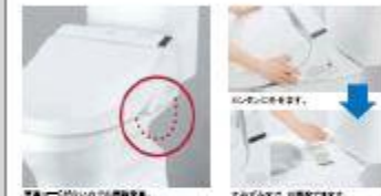
裏面も拭きやすいのでお掃除がラク

ウォッシュレット本体がタンクに取り付け、便座とタンクの間に 本体の裏面など、拭きにくい箇所も拭きやすくなります。