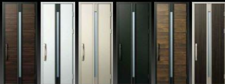
ボニーアカンパ(4F) 6,8R / 3,4 / 0,8 ビュアシルバー(41) 9,38 / 8,0 / 0,1 プラチナステン(42) 3,0Y / 6,7 / 0,6 コームブラック(43) 9,3P / 3,2 / 0,3 スキークロココ(44) 6,9YR / 3,7 / 1,2 黒鉄(45) 9,8R / 3,1 / 0,4